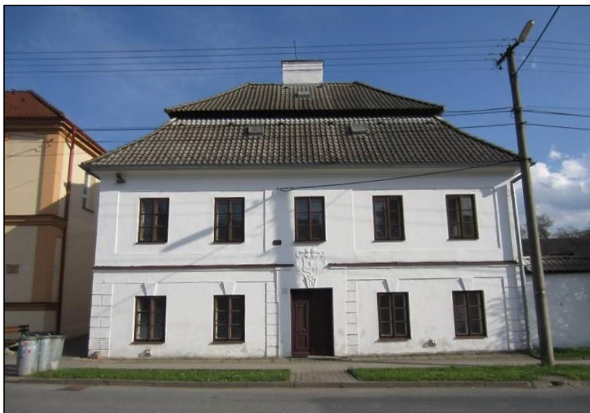
Čelní pohled na faru, foto: Památkový katalog, upraveno.

Vaším úkolem je zaměřit se na erb rodu Stockhammerů nad vstupem do fary. Erb obsahuje čtyři pole a střední štítek. Zjistěte, v kolika z těchto pěti částí erbu se vyskytují zvířata. Zvířata v klenotu erbu (nad přilbami) nepočítejte. Číslici запиšte do čtvrtého pole Vašeho hesla. Nezapomeňte se u fary vyfotografovat!