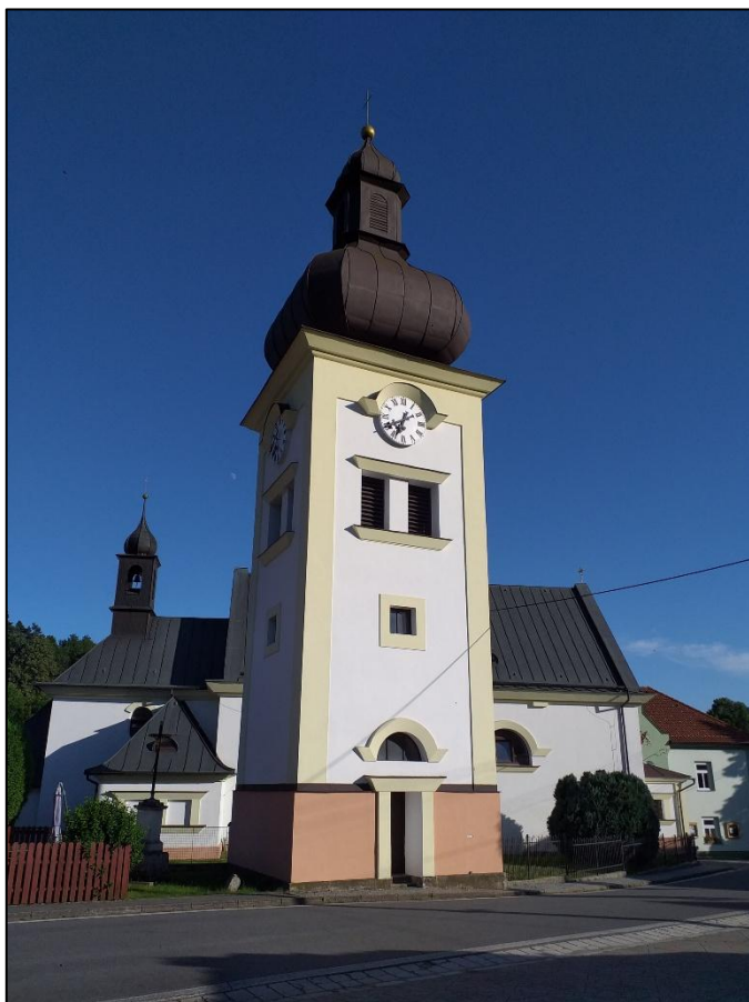
Zvonice na štěpánovském náměstí.

Napravo od vstupu do zvonice se nachází drobná tabulka upozorňující na nivelační bod. Do třetího pole Vašeho hesla si запиšte předposlední písmeno ze třetího slova na tabulce. Nezapomeňte se u zvonice vyfotografovat!