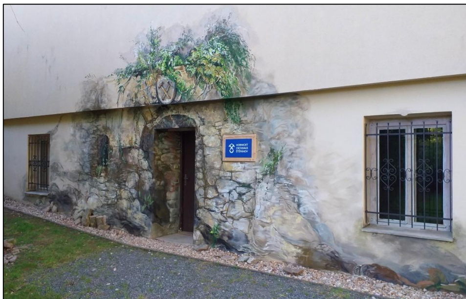
Vstup do Hornického cechhausu zdobený od srpna 2024 bohatou výmalbou.

Vaším úkolem u Hornického cechhausu je prohlédnout si částečně zachovalý znak Pernštejského panství. Ústřední figura – zubří hlava byla bohužel v minulosti značně poškozena. Do prvního pole Vašeho hesla napište první písmeno z názvu objektu, který perňštejské zubří hlavě chybí a zároveň není součástí zvířecího těla. Nezapomeňte se u Cechhausu vyfotografovat!