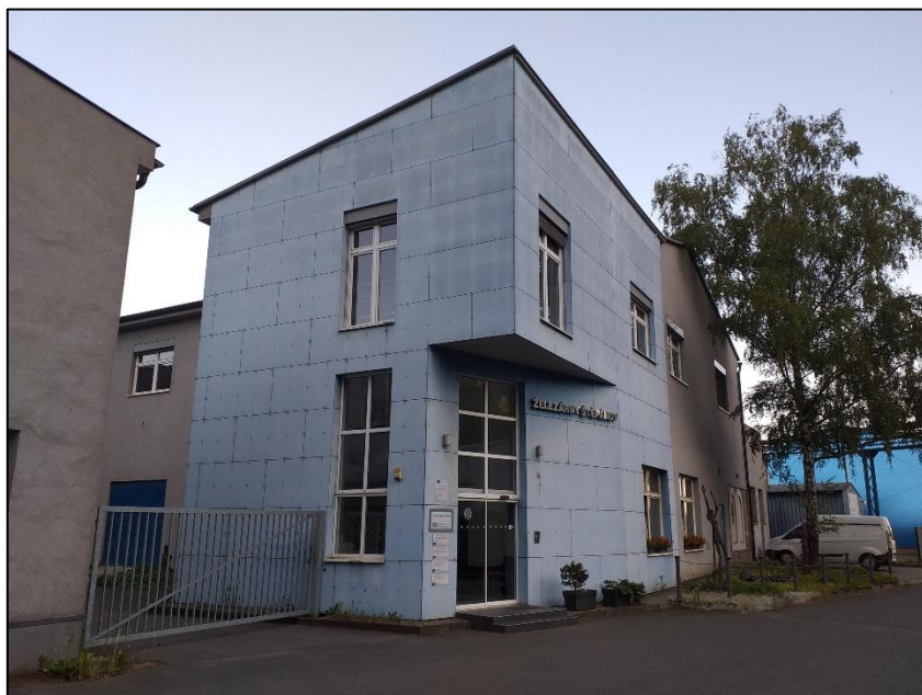
Budova štěpánovských železáren s pamětní deskou.