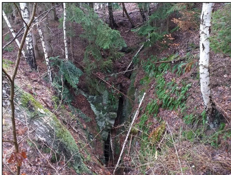
Pohled na tzv. štolu Kryštof

Štola Kryštof je z bezpečnostních důvodů ze strany cesty ohraničena krátkým plotem. Vaším úkolem je spočítat, kolik kovových, nahnědo natřených, sloupků tento plot podpírá. Číslo zapište do třetího pole Vašeho hesla. Nezapomeňte se na místě vyfotografovat!