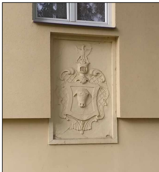
Litinové plastiky před Hornickým cechhausem a torzo znaku Pernštejského panství