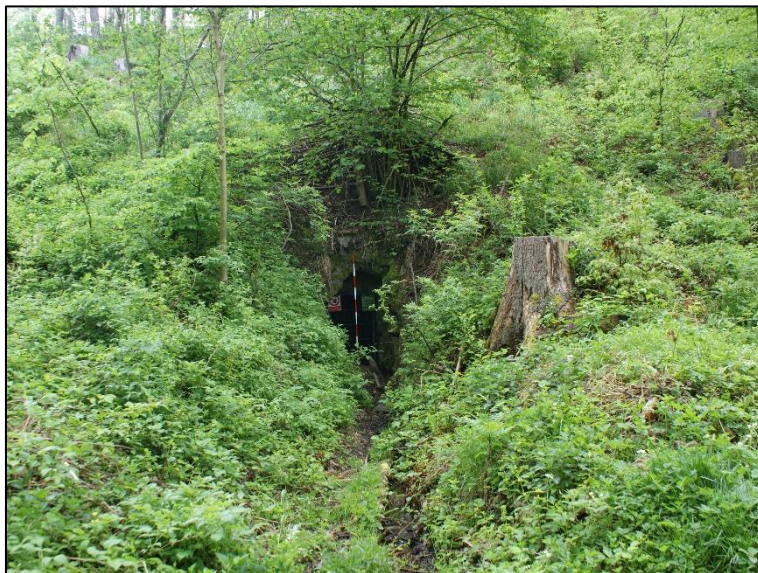
Štola sv. Antonína Paduánského obklopená bujnou vegetací