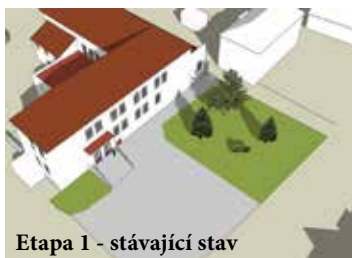
Etapa 1 - stávající stav