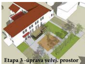
Etapa 3 - úprava veřej. prostor