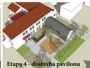
Etapa 4 - dostavba pavilonu