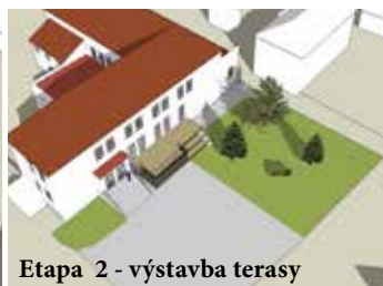
Etapa 2 - výstavba terasy