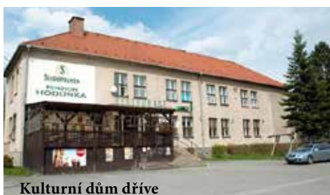
Kulturní dům dřívě

stavby, pro kterou je právě vybírán zhotovitel, bude pořízeno nové technické vybavení do IT učebny a učebny jazyků, dále nové vybavení pro polytech-