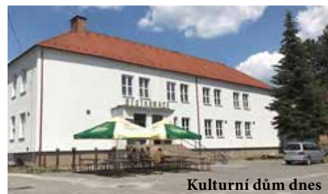
Kulturní dům dnes