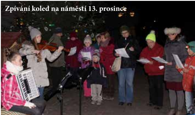
Zpívání koled na náměstí 13. prosince